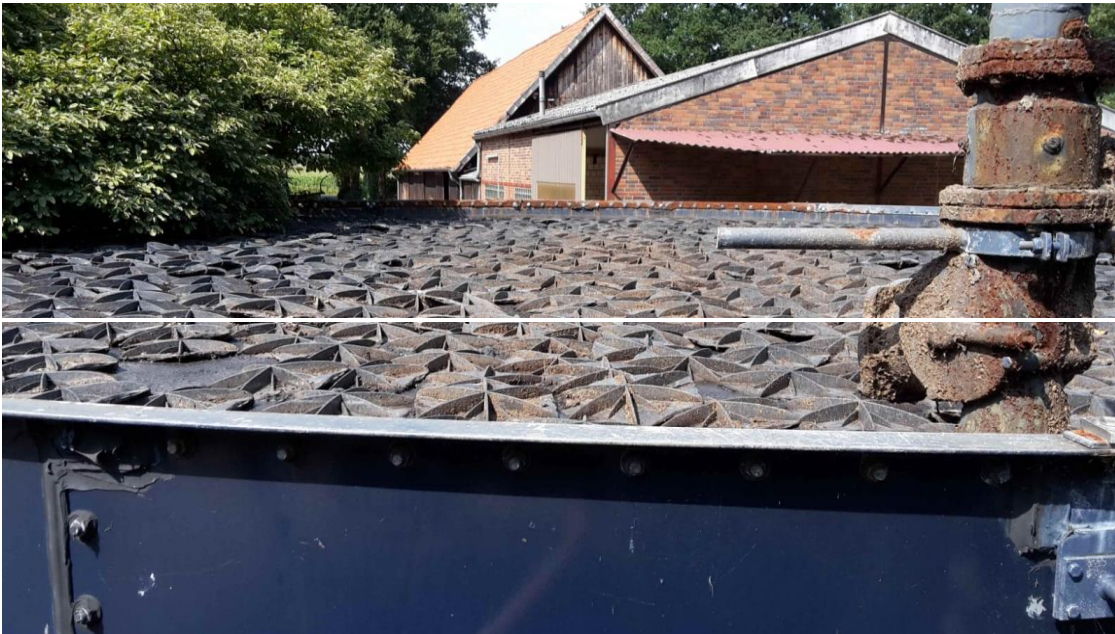
Figure 5: at the end of the measurement – 06.08.2019

Over the entire period, the floating cover, plus a smaller portion of natural swimming layer, covered the silo almost evenly. The wind did not affect the Cover; they were not blown away or blown on top of each other. Also at the end of the measurement the covers were evenly distributed: